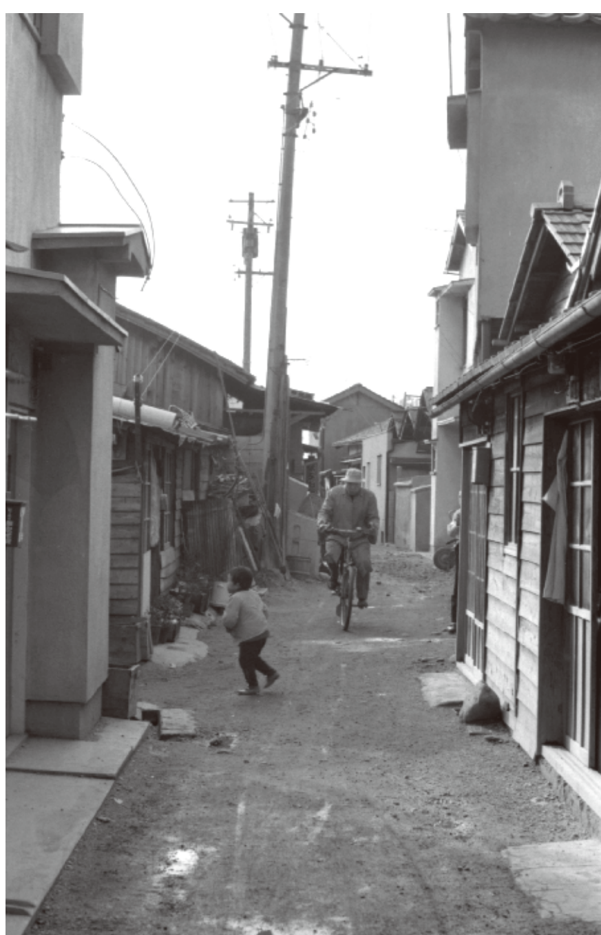
◀昭和 35 (1960) 年 小花1 ?

旧国道 176 号と阪急電鉄宝塚線の交差部から東側（池田方面）を望んでいます。道路右側手前の商店では炭を取り扱っているようで、津の国屋さん？のオート三輪に炭が詰まった袋がたくさん積み込まれています。この炭は市北部の特産品の一庫炭と思われます。