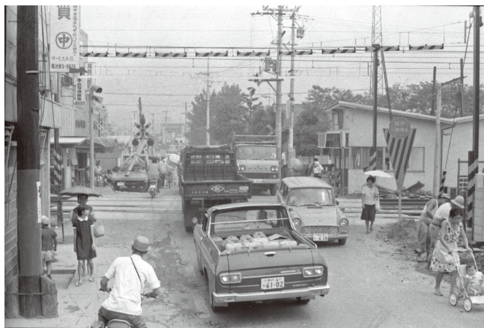
▲撮影時期不明 (昭和 42 (1967) 年以降) 栄町

阪急電鉄と能勢電鉄の川西能勢口駅の西側にあった踏切付近を写しています。線路を横切る道路は県道の尼崎池田線です。片側 1 車線ずつの踏切は増加する自動車ですいつも混雑していました。この渋滞を解消することが、後の鉄道高架化事業の大きな理由のひとつでした。踏切を向こうに渡ろうとしているのはトヨタ・マスターライン・ピックアップ (3 代目) という、クラウンがベースの商用車で、昭和 42 (1967) 年に発売されました。その右側をこっちに向かって走るのはトヨタ・パブリカ・バンで、これも同年に車種追加されました。このことから、この写真は同年以降に撮影されたものと分かります。昔の写真の撮影時期を判定するのに、写っている自動車が役に立ちます。