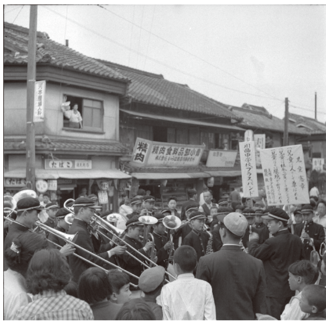
▲昭和 32 (1957) 年 5 月

昭和 31 (1956) 年、水田を埋め立てて巨大な商業施設「新町市場」が出現しました。100 軒以上の商店と 2 つの映画館を備えた、今でいうところのショッピング・モールでした。写真は翌年の撮影で、前年 (S31) に定められた児童憲章を啓発するため、川西中学校のブラスバンドが新町市場付近で演奏を披露しています。新町市場は現在ではみつなかホールやシャントかわにしに姿を変えました。