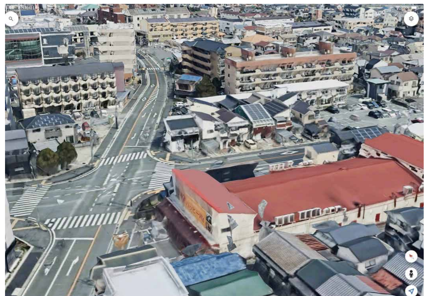
▲昭和 35 (1960) 年 美園町

昭和 35 (1960) 年の台風 16 号の被害を記録した写真のうちの 1 枚で、美園町のスーパーマーケット「北摂百番街」(現・ハッピー川西) の建築現場も被害を受けたようです。