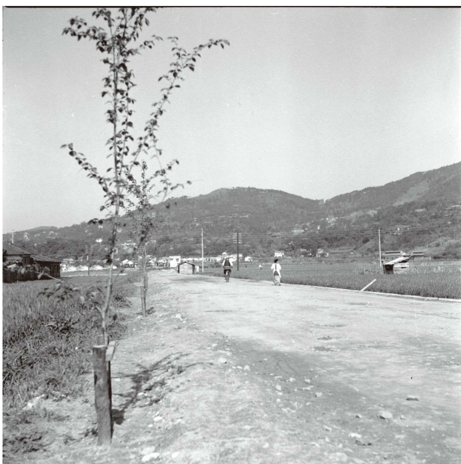
▲昭和 32 (1957) 年 4 月 中央町

新たに建てられた旧・市役所前から花屋敷方面へ向かう道路で両側は田畑が広がっています。路面は未舗装で自動車は見え、自転車や割烹着姿で婦人がのんびりと通行しています。