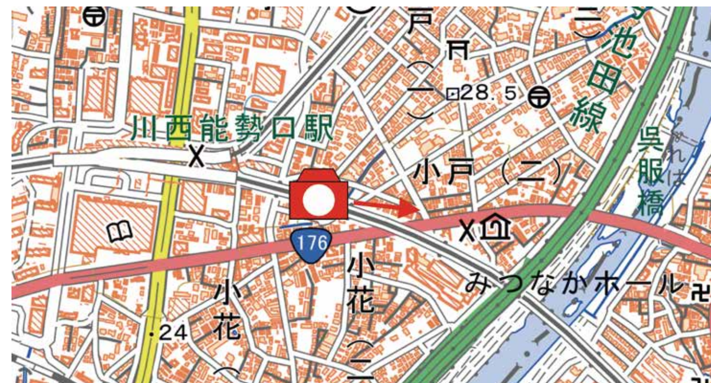
▲撮影時期不明 小花2

旧国道 176 号と阪急電鉄宝塚線の交差部から東側（池田方面）を望んでいます。道路右側手前の商店では炭を取り扱っているようで、津の国屋さん？のオート三輪に炭が詰まった袋がたくさん積み込まれています。この炭は市北部の特産品の一庫炭と思われます。