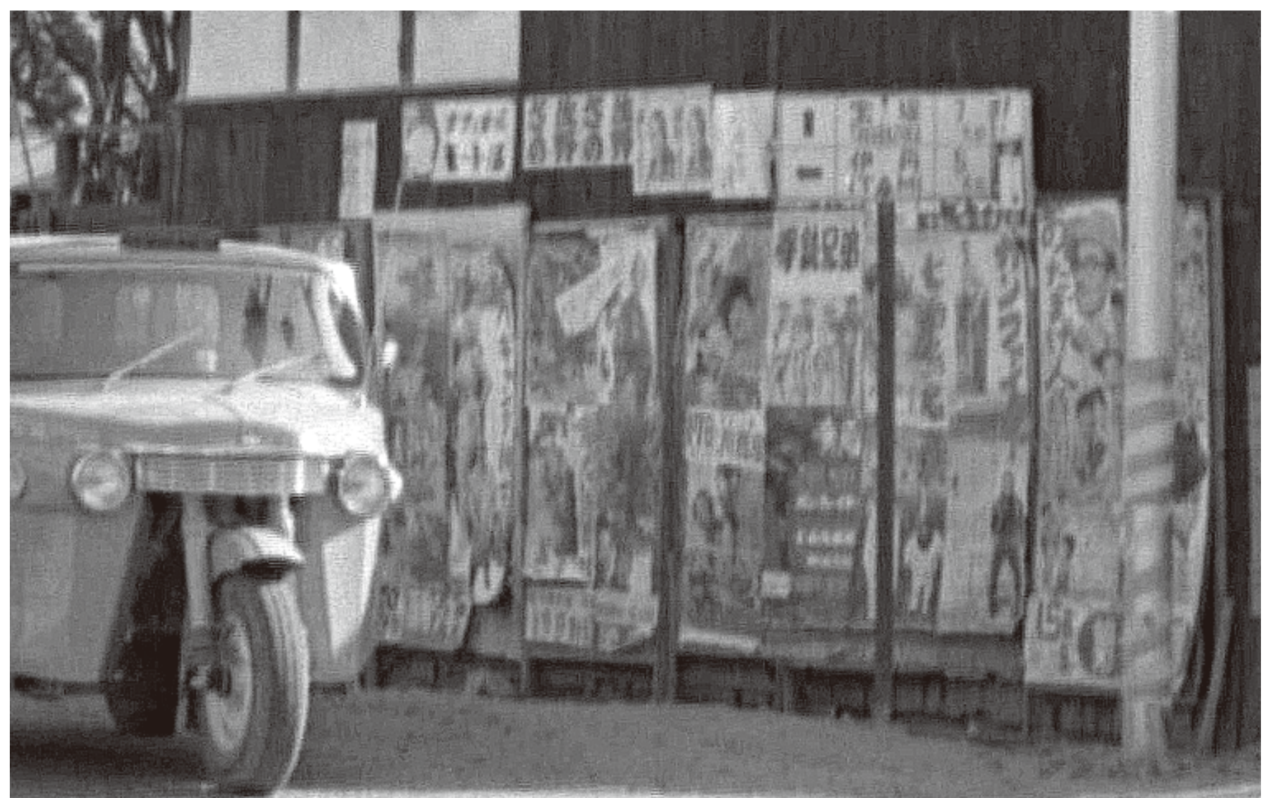
▲昭和 37 (1962) 年 小花 1

国道 176 号と県道尼崎池田線が交差する今辻交差点です。オート三輪がドヤ顔で信号が変わるのを待っています。その背後の壁には映画のポスターが所狭しと貼られています。拡大して観察すると、「拳銃兄弟」(1945 年製作?) 「ガンファイター」(ロック・ハドソン、カーク・ダグラス主演) 「おったまげ人魚物語」(伴淳三郎主演) などのポスターが確認できます。