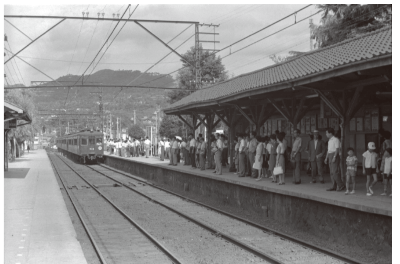
▲①昭和 32 (1957) 年 ②③昭和 39 (1964) 年? ④昭和 40 (1965) 年 3月以前 ⑤昭和 40 (1965) 年 7月以降 ⑥撮影時期不明

駅名は「能勢口駅」(昭和 40 (1965) 年 3月まで)→「川西駅」(但し能勢電鉄のみ/昭和 40 年 4月~6月)→「川西能勢口駅」(昭和 40 年 7月~)と変遷したので、駅の看板も変化しています。写真②と③には駅南側の留置線と資材運搬用の貨車が写っています。