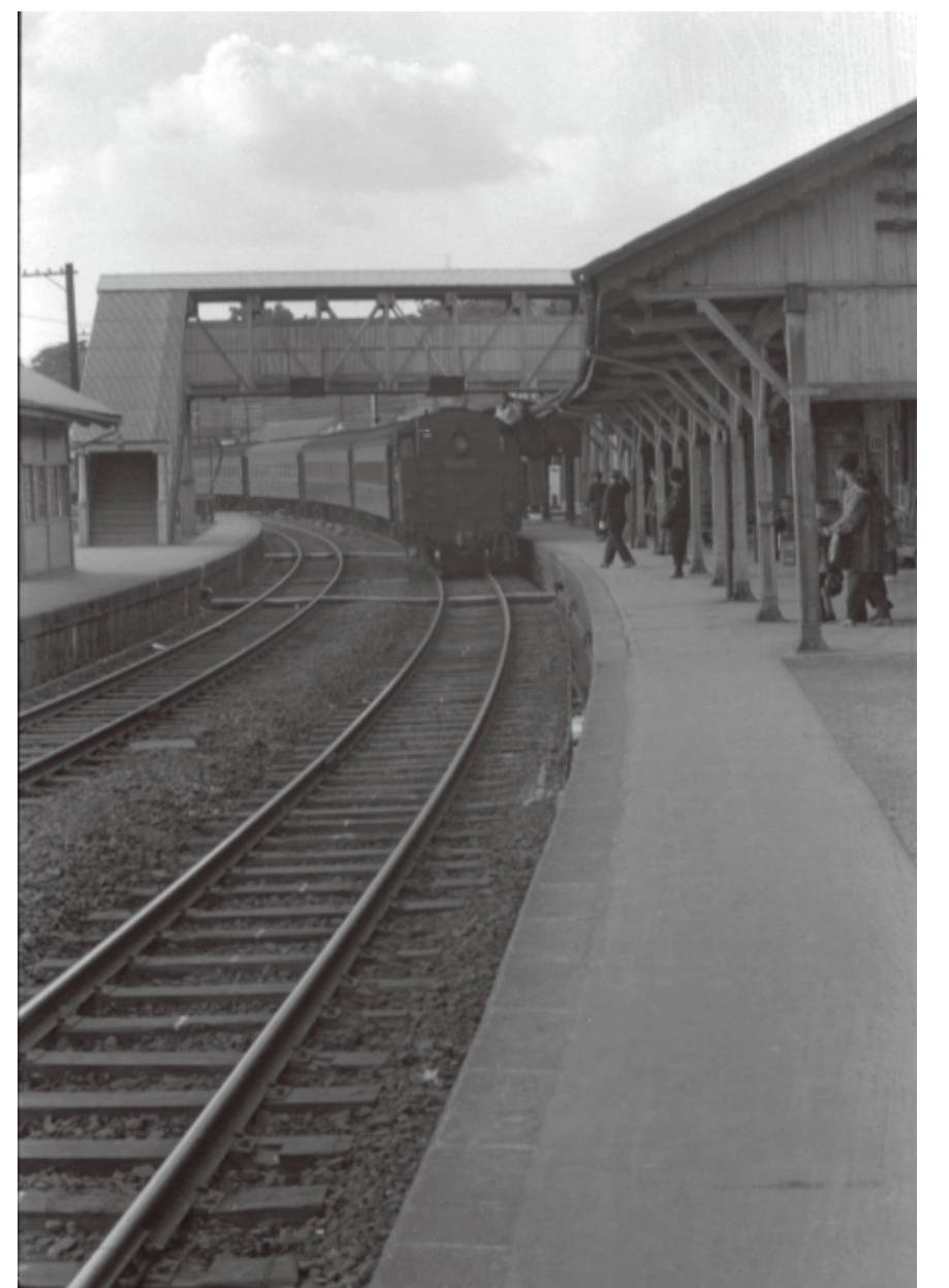
▲昭和 34 (1959) 年 撮影場所不詳